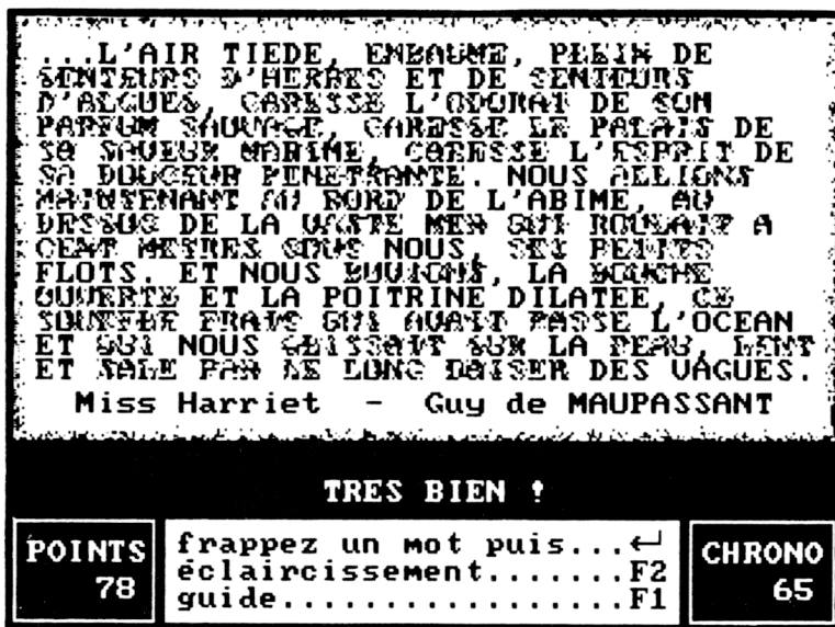
Figure 1 : CRYPTEXT allie au plaisir de l'exploration du sens d'un texte et de la découverte du style de son auteur, la pratique de la rigueur de l'orthographe et des accords. Au début tous les mots sont brouillés. Chaque mot correctement tapé va s'afficher à sa place dans le texte et fait se révéler un peu la partie restante encore brouillée.