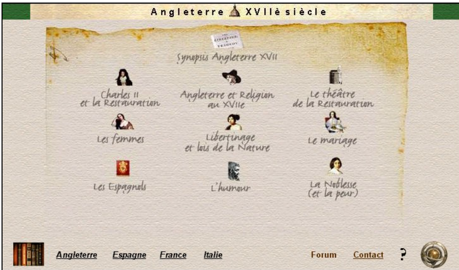
Une carte du site : l'Angleterre

Pour chaque pays, il y a trois modules de contexte, à propos de la politique générale, de la religion et du théâtre, conçus pour donner un cadre de référence, et des modules liés à l'œuvre qui s'inspirent directement des versions de Don Juan et développent des thèmes spécifiques aux différents auteurs. Des fiches viennent compléter ces modules, des codes de couleur permettent d'identifier les liens suivant qu'ils renvoient à des modules, des fiches, des définitions (qui s'affichent en surimpression sur l'écran) ou aux synopsis et aux personnages des œuvres. Des codes de couleur sont de même utilisés pour différencier chaque pays qui a sa couleur de référence. La navigation est aussi facilitée par des repères permanents qui donnent la possibilité de revenir facilement au tableau de départ d'un pays. Un guide de l'utilisateur permet de se familiariser avec la structure du site et ses codes de couleur.