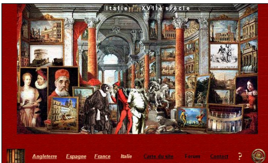
Un tableau : l'Italie