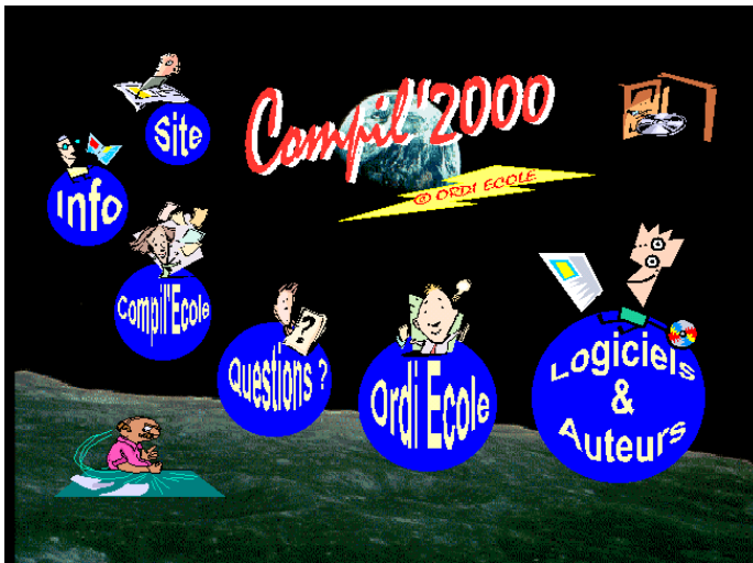
Aides et informations en ligne

Ce produit est accompagné d'un livret papier volumineux mais pratique à consulter et composé de deux parties. La première, après la présentation du cédérom, donne des informations claires et précises, à la portée d'un enseignant même peu expert en informatique, sur la façon de lancer l'interface du cédérom soignée et conviviale. Cette facilité n'a toutefois pas pour vocation « de remplacer une formation de base à l'utilisation de l'ordinateur » comme le rappellent fort à propos les concepteurs. Par contre, au fait des équipements disponibles sur le terrain, ils ont eu la bonne idée de structurer ce cédérom de manière à offrir aux utilisateurs la possibilité d'installer les logiciels destinés à des configurations plus modestes (ou ne possédant pas de lecteur de cédéroms) après une copie sur disquette(s) (à l'exception de quelques logiciels).