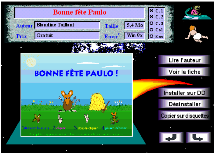
Une installation facilitée par une interface conviviale

L'interface de Compil'2000 est réalisée avec Présente (le logiciel de Jean-Marc Campaner bien connu pour la qualité de ses productions). Elle fonctionne sur tout ordinateur PC ou compatible équipé de Microsoft Windows 3.1* ou Windows 95/98. Quant aux logiciels, leur configuration minimum est spécifiée sur leur fiche.